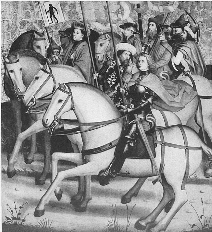
Links: Meister des Sterzinger Altars: Der Reiterzug der hl. 3 Könige. — Unten: Albrecht Dürer: Bildnis Michael Wolgemuts.