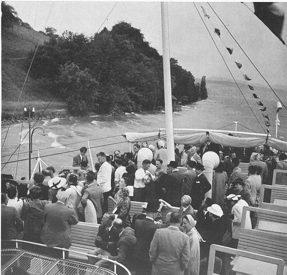
Links: Auf der stimmungsvollen abendlichen Dampferfahrt nach der Halbinsel Au. — A gauche: Balade au crépuscule dans les parages de la presqu'île d'Au.