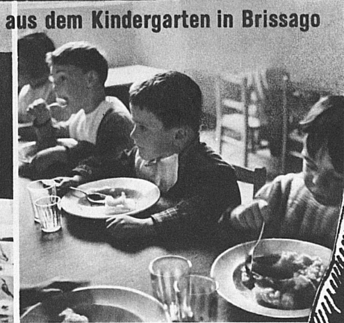
aus dem Kindergarten in Brissago