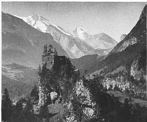
Oben: Die romantische Felsenburg beim Blausee mit Blick gegen Altels und Rinderhorn. Die Lötschbergbahn umfährt sie in großer Kehre. — En haut: La pittoresque ruine de «Felsenburg» près du lac Bleu; coup d'œil sur l'Altels et le Rinderhorn. Le chemin de fer du Lötschberg l'entoure d'un large cercle pour gagner de l'altitude.