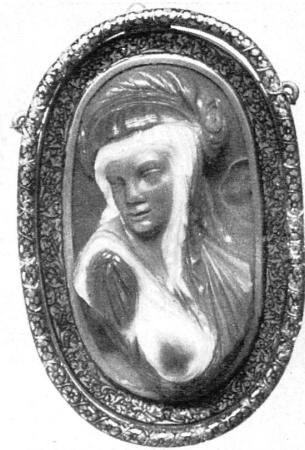
Achatkamee, Mailand, 1560—1580.