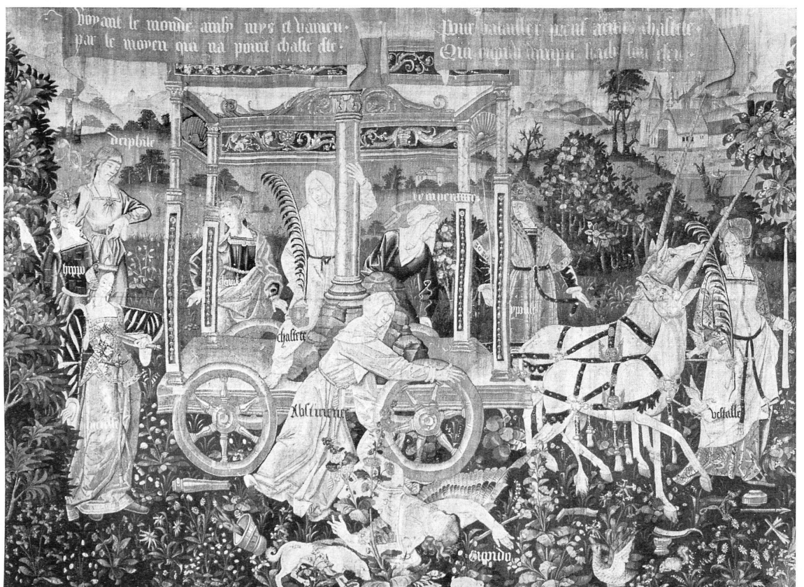
Oben, von links nach rechts: Maria auf der Weltkugel, Salzburg, Anfang 18. Jh. — Krummstab mit Verkündigung, Elfenbein, italienisch, 1. Hälfte 14. Jh. — Unten: Triumph der Keuschheit über die Liebe, Tapissérie, südfranzösisch, Anfang 16. Jh.

schrift wachsen nach und nach zum Ornament, dann zur symbolhaften Vignette, endlich zur Illustration des Textes. Sind sie zunächst gemeinsame Arbeiten mittelalterlicher Schreibstuben, so tritt der einzelne Künstler in den farbigen Holzschnitten (Kunsthaus) aus seiner Anonymität heraus. Ähnlich verhält es sich mit der Kleinplastik. Aus dem Bedürfnis, Geräte des kirchlichen und häuslichen Gebrauchs zu verzieren, den Henkeln von Krügen und Schalen figürliche Formen zu verleihen, schwingen sich anmutige Putten und Engel, lachende Götter und derbe häusliche Gestalten empor. Wie zierlich nehmen sich Trinkgefäße, Kannen und Schüsseln der Nürnberger Goldschmiedefamilie Jamnitzer aus, wie niedlich das burgundische Häftlein, auf dem in winzigen Figürchen ein Brautpaar dargestellt ist (Abb.)! Aber auch kirchliche Geräte entbehren nicht des künstlerischen Schmuckes. Davon zeugen die kleinen Reliquienschreine und Altärchen der Frührenaissance, der elfenbeinerne Krummstab aus Venedig, der in seiner Curva eine sauber geschnittene Verkündigung birgt (Abb.), und die reichen Stickereien auf Kaseln und Ornaten des 12. und 13. Jhs. (Abb.). Diese Maßgewänder und Altartepiche dienen später Tapissieren für den häuslichen Schmuck zum Vorbild. Zyklische Darstellungen, wie Petrarca's Trionfi (Abb.), Vertumnus und Pomona sind echte Renaissance-Themen und erzählen uns von einer geruhsameren Zeit, die noch mit Sinn und Muße begabt war, so viel künstlerisches Erleben in sich aufzunehmen.