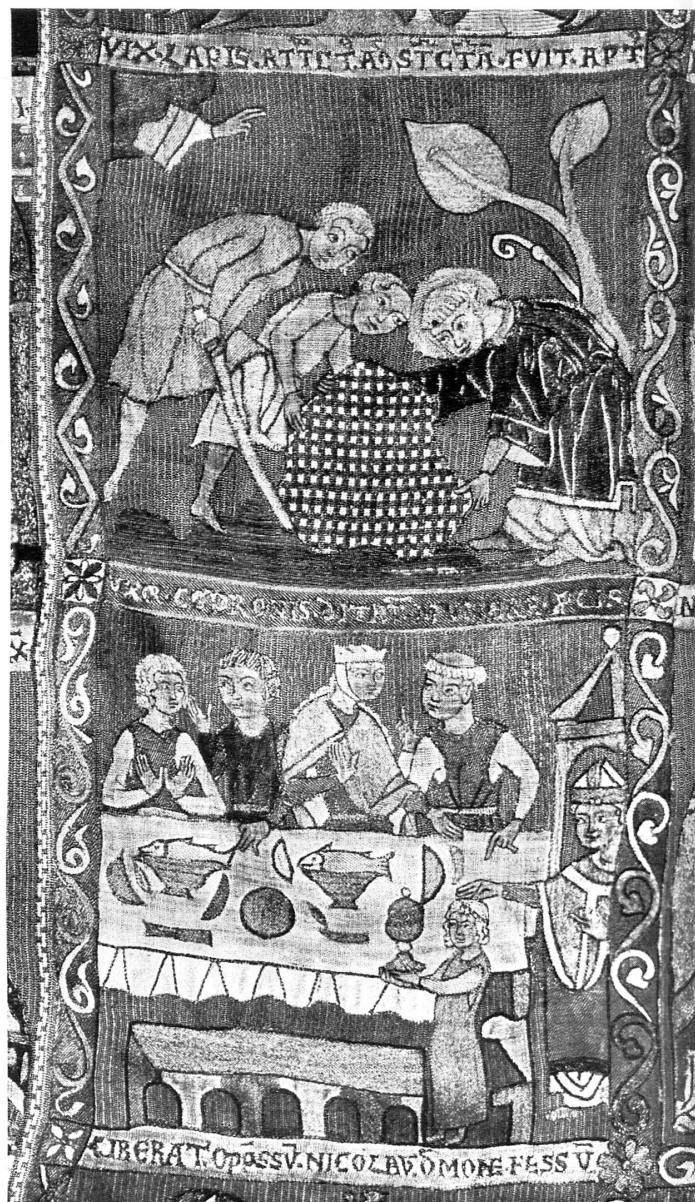
Glockenkasel aus St. Blasien im Schwarzwald, süddeutsch, 13. Jh.