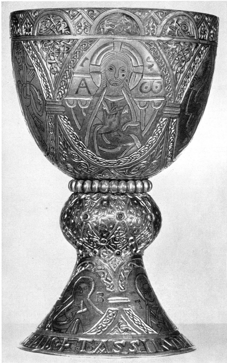
Oben: Tassilokelch, süddeutsch, um 770.

Schon mehr als drei Monate währt die Doppelausstellung der « Meisterwerke aus Österreich », und noch immer hält der große und begeisterte Besucherstrom an. Daß er im Kunsthaus ungleich größer als im Kunstgewerbemuseum ausfällt, ist ein Zeichen unserer Zeit — und nicht das beste: Viele wollen nur die großen Namen, die berühmten Künstlerpersönlichkeiten sehen, das, wovon schon so oft gesprochen und geschrieben wurde, dessen Wert ewig und unbestreitbar bleibt. Aber das Kleine, Intime kommt dabei entschieden zu kurz. Wem gelingt es, sich an der schönen Form eines Kelches oder an der kolorierten Seite einer Handschrift ebenso zu erfreuen wie an einem Porträt Rembrandts oder Tizians? Freilich heißt man das eine freie, angewandte Kunst das andere. Aber wer möchte die Grenze ziehen zwischen beiden? Auch die freie künstlerische Schöpfung bleibt letztlich irgendwie gebunden an den Gegenstand, in der Befangenheit des bestimmten Auftrags, an das Material usw. Und es gibt Zeiten mit stärkerer Bindung, in denen alles mehr stilisiert, ornamentiert und auch dekoriert erscheint, und solche, die dem seelischen Ausdruck mehr Raum gewähren. Gerade die beiden Teile der Ausstellung mit ihren gemeinsamen Berührungspunkten in den Bildteppichen, Buchmalereien und Kleinplastiken können uns Herkunft und Wandlung der einzelnen Zweige vor Augen führen: Schnörkel und Zierat der Hand-