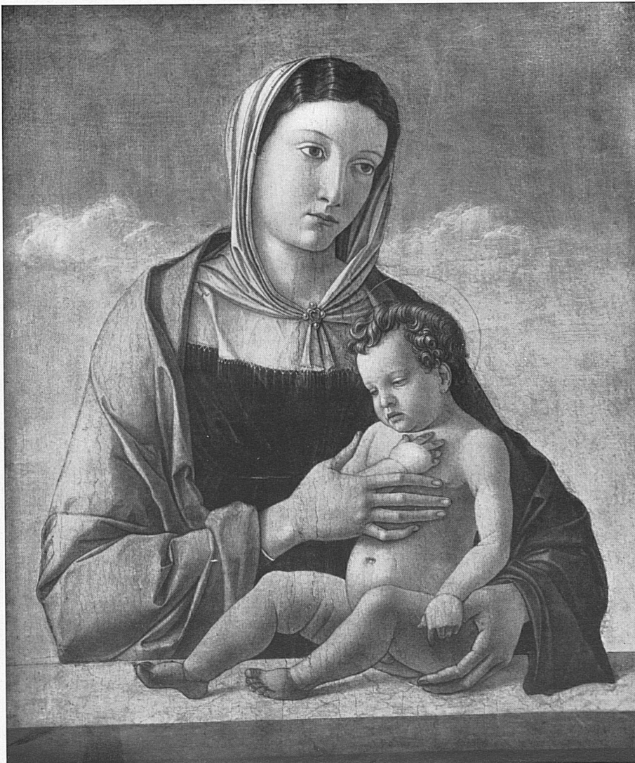
En bas, de gauche à droite : Giovanni Bellini : La Madonna col Bambino. Venezia, Museo Correr. — Giovanni Bellini : Croci fississime. Venezia, Museo Correr.