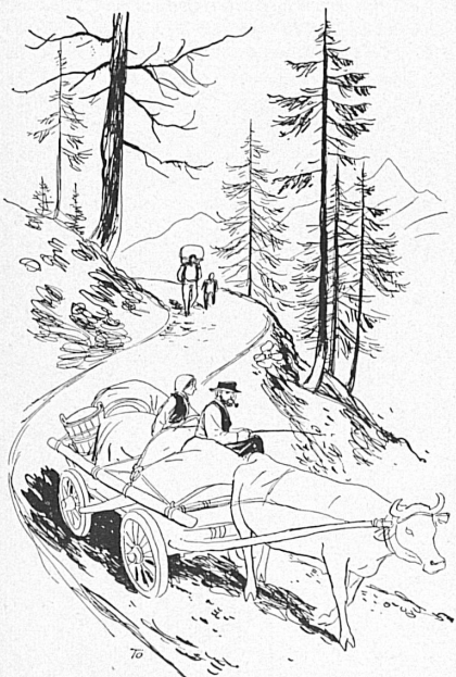
Zeichnung von H. Tomamichel.

Der Berghilfe stehen ausschließlich jene Mittel zur Verfügung, die in der alljährlichen Sammlung zusammenfließen. Uns Schweizern sind die Berge Sinnbild unserer Freiheit und unseres Widerstandswillens. Und darum sind uns jene Männer und Frauen nah, die unter Rufen- und Lawinendrohung ihr tägliches Brot erwerben — und doch nicht flüchtig werden, weil sie die Heimat nimmer lassen können. Wahrhaftig, sie verdienen unsere herzliche Zuneigung und unsere offene Hand. — Berghilfe-Sammlung, Postcheck-Konto VIII 32 443 Zürich. yz.