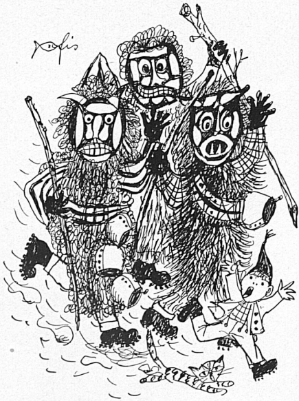
Oben, von links nach rechts: «Roitscheggeten» aus dem Lötschental, Zeichnung von Hans Fischer. — Das Skigelände von Crans. — En haut, de gauche à droite: Les «Roitscheggeten» du Lötschental, dessin de Hans Fischer. — Pistes de ski à Crans.