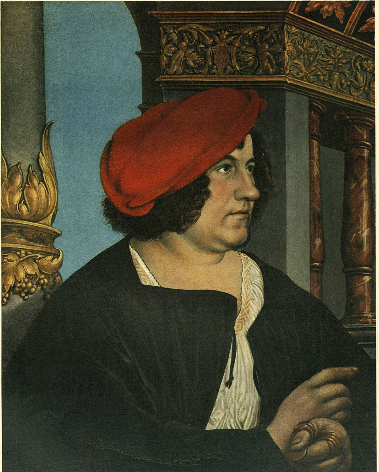
Hans Holbein d.J.: Bildnis des Basler Bürgermeisters Jakob Meyer zum Hasen, des bedeutenden Handelsherrn zu Beginn des 16. Jahrh. (Basler Öffentliche Kunstsammlung)