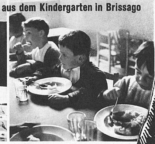
aus dem Kindergarten in Brissago