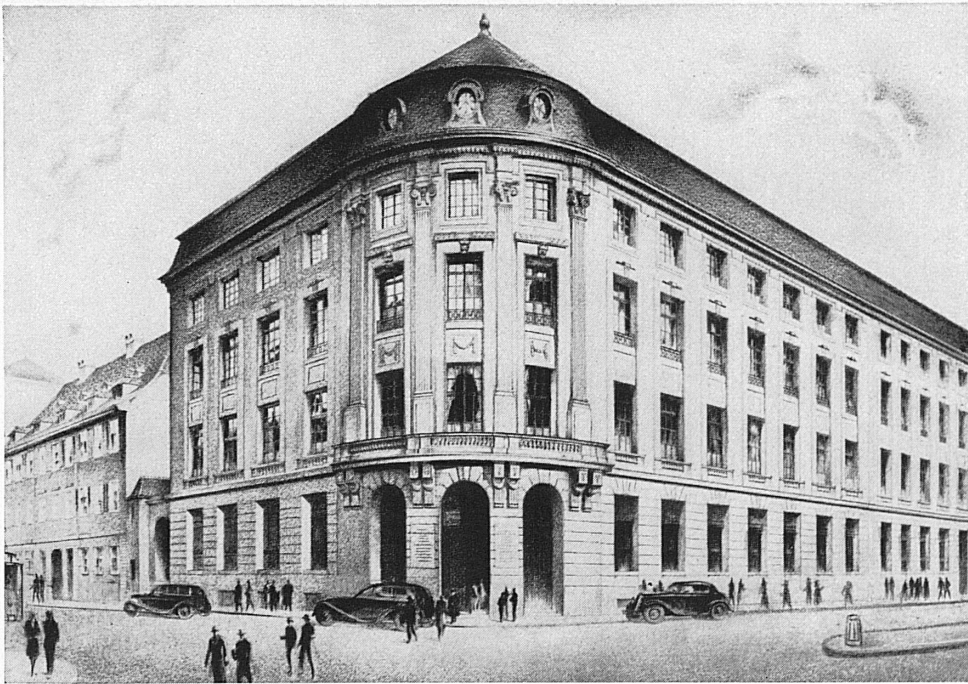
Bankgebäude in Basel - Hôtel de la banque à Bâle