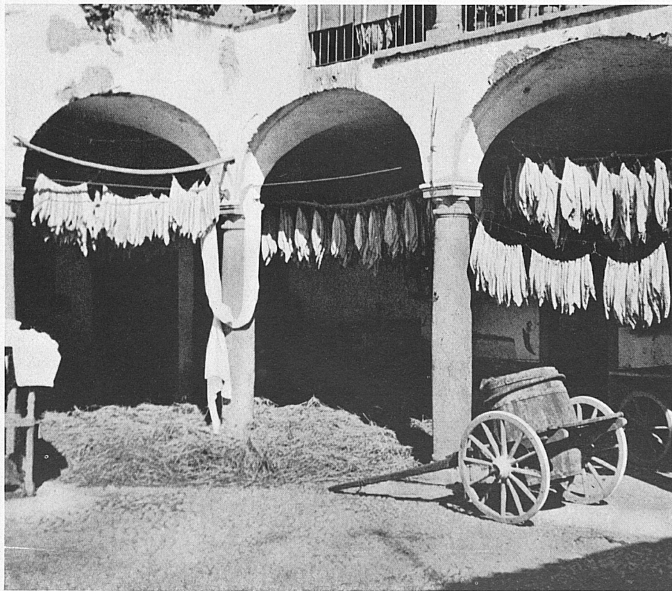
A gauche: Les arcades de cette ferme tessinoise sont utilisées comme lieu de séchage des feuilles de tabac. — Links: Der Bogengang als Tröckneraum für den Tabak. Hof eines Bauernhauses im Mendrisiotto.

On n'apprécie pourtant pas le Mendrisiotto dans tout son charme particulier si l'on se borne à traverser la plaine. Les paysages et les villages des collines valent la peine d'une visite. Voyez par exemple sur les pentes du San Giorgio le charmant village de Méride, avec ses exquises vieilles demeures, ses balcons à balustrades de fer forgé qui dessinent de fines arabesques. Ce sont les témoins d'une époque de bien-être et de goût, comme aussi les maisons de style de Ligonetto, patrie du sculpteur Vincenzo Vela; l'architecture particulière de ce bourg et sa situation pittoresque le rendent fort attachant. De l'autre côté de la vallée, Morbio Superiore et l'arc de son viaduc; l'idyllique petite église de San Martino dans son cadre de