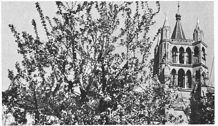
En haut : Lausanne et sa cathédrale au printemps. — Oben: Lausanne mit seiner Kathedrale im Frühling.

devenit poez au sud. poezije alpie, le Léman finit dans un poezije classique, on tout est d'ici et là, robuste et paisible. Image de l'homme qui en devient être : nousi de force et d'humanité, devenu un artisan de beauté! Paul Budy