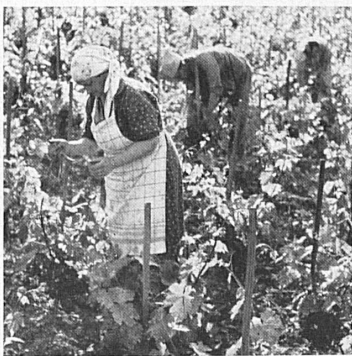
En haut : Les effeuilleuses au travail dans les vignes. — Oben: Die Rebberge sind von den savoyischen «Effeulleuses» bevölkert, welche die Rebschöhlänge an die Stecken binden.

C'est une véritable symphonie de sons et de couleurs qui, chaque printemps, nous enchante à nouveau. Le charme magique qui se dégage du mot « Léman » opère en cette saison par sa diversité même: la grande nappe bleue reflétant le vert tendre des forêts, les champs de narcisses, vastes tapis blancs, et plus haut les montagnes dont les pentes neigeuses laissent peu à peu apparaître la roche, alors que retentit dans l'air le joyeux concert des oiseaux accom-