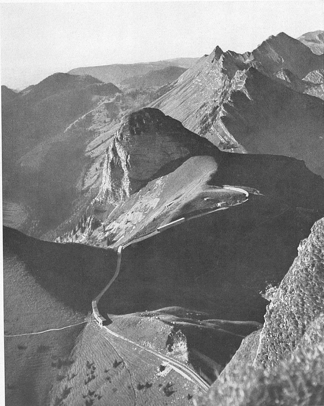
A gauche: Du sommet des Rochers-de-Naye, le regard embrasse tout le Léman et s'étend jusqu'au cœur même des Alpes. Au premier plan, la ligne du chemin de fer à crémaillère et la Dent-de-Jaman. — Links: Von den Rochers-de-Naye schweift der Blick nicht nur über den ganzen Léman, sondern auch weit über die Alpenwelt. Vorne das Trasse der Bergbahn und die Dent-de-Jaman.