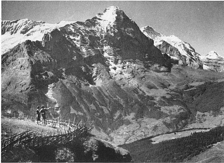
Ausblick von First gegen Eiger und Jungfrau