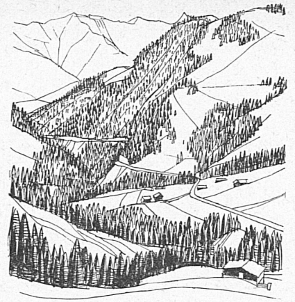
Au col des Mosses.

Suivons le cours de cette rivière. Il nous conduira vers notre point de départ par Gstaad, la grande annexe hôtelière de Gessenay (ou Saanen), chef-lieu agreste de la Haute-Gruyère, aux monumentales mai-