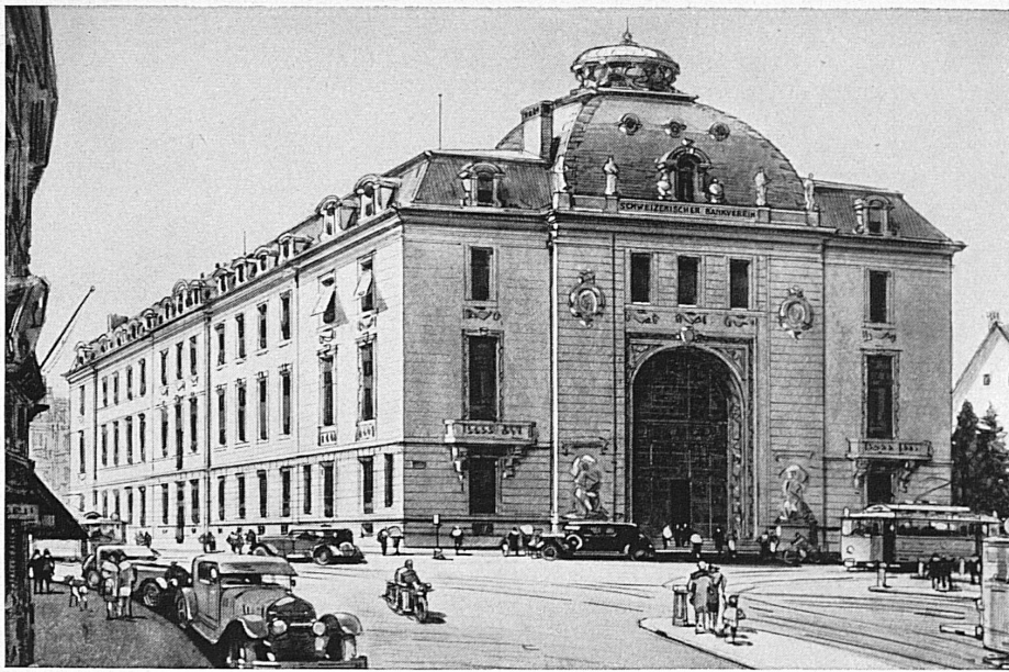
Bankgebäude in Zürich - Hôtel de la banque à Zurich