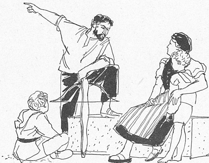
Tell mit den Seinen. — Guillaume Tell avec les siens.

erst in gedrängten Reihen sitzen und aus dem Mund der Mannen und der Frauen die alten, längst bekannten Verse hören, so fühlen wir, wie neues Leben aus ihnen sprüht. Kaum einer der Zuschauer wäre, der sich an dem nicht ganz korrekten Theaterdeutsch stieße; im Gegenteil — der herbe, rauhe Ton der Sprache, der schwere Gang