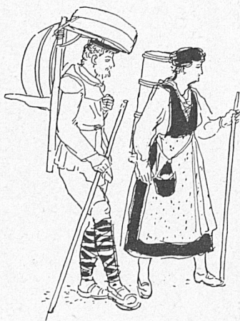
Leute aus dem Volk. — Gens du peuple. (Tellspele Interlaken)

Man ginge freilich fehl, wollte man glauben, daß die Mitspieler ihre Rolle im stillen Kämmerlein ausproben und dann frischfröhlich vor die Menge treten. Bereits im Januar haben die Interlakner Spieler mit den Proben für die Vorstellungen begonnen. Und