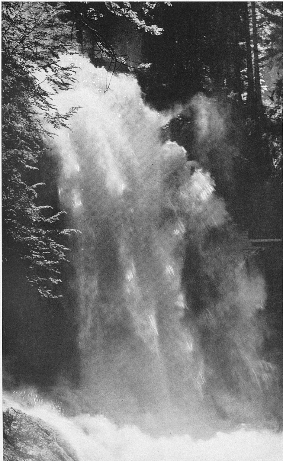
Einer der imposantesten Fälle der insgesamt 14 Wasserstürze, welche der Gießbach vor seiner Mündung in den Brienersee in großartiger Waldlandschaft beschreibt. — L'une des plus imposantes des 14 cascades du Giessbach qui se jette dans le lac de Brienz.