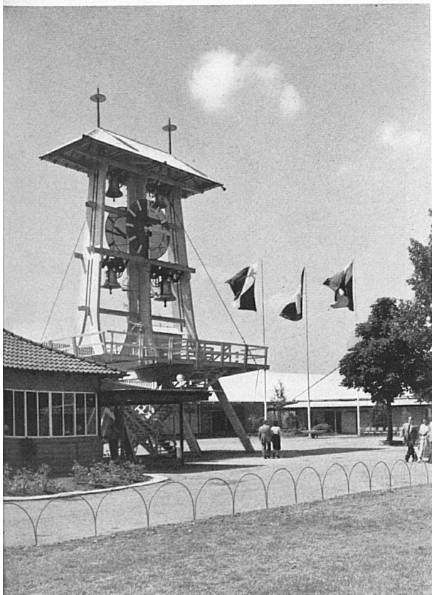
Oben: Der inmitten der Ausstellung erbaute Glockenturm verkündet die Stunden. — En haut: L'horloge de la tour érigée au centre même de l'exposition sonne les heures.