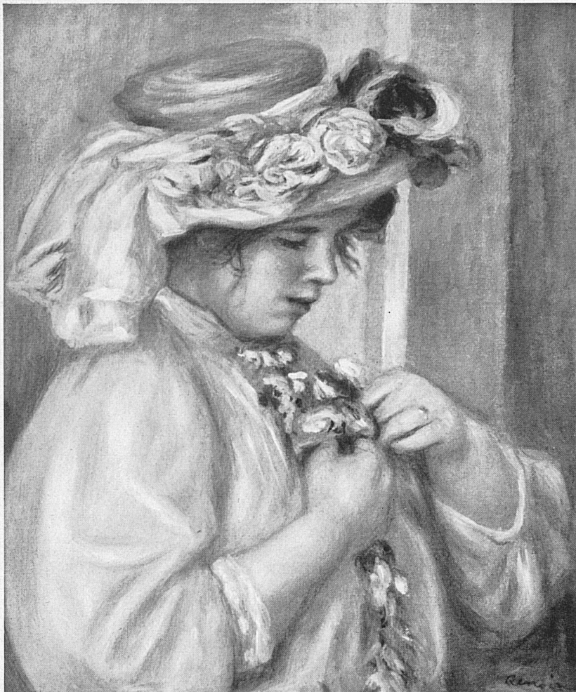
Links: Auguste Renoir: Jeune fille fleurissant son corsage. — Junges Mädchen beim Blumenanstecken. Sammlung Georg Reinhart, Winterthur.