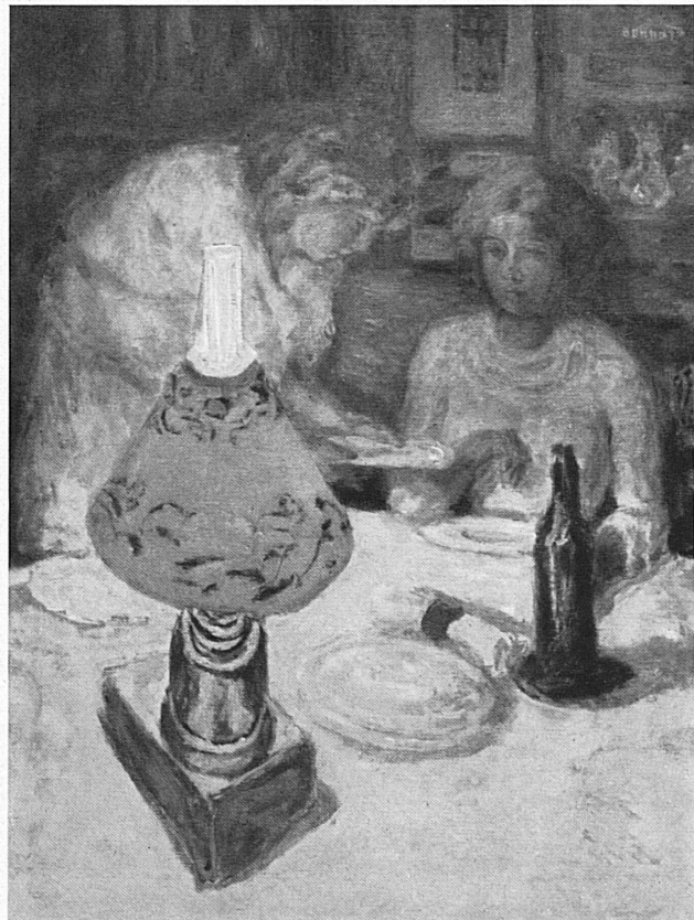
Oben: Pierre Bonnard: Le souper. Privatbesitz Winterthur.