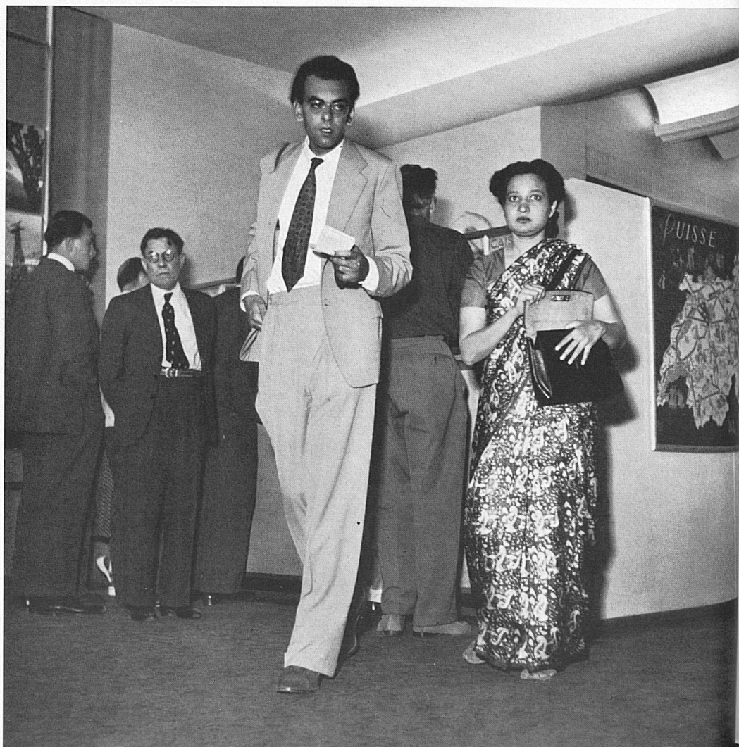
A droite: Les futurs hôtes de la Suisse se donnent rendez-vous dans les agences de l'O. C. S. T. Voici un couple d'Hindous que l'on remarque à peine parmi la multitude de clients de toutes nations qui se pressent à l'agence de Paris. — Rechts: Schweizer Gäste aus aller Herren Ländern geben sich in den Agenturen der SZV Rendezvous. Hier ein indisches Ehepaar, das unter den übrigen internationalen Kunden des Pariser Büros gar nicht so auffällt, wie man es vermuten könnte.

den Gast beginnt vielmehr schon bei ihm zu Hause. Den sechzehn ausländischen Agenturen der Schweizerischen Zentrale für Verkehrsförderung kommt in diesem Rahmen die größte Bedeutung zu. Ihre Leiter wirken — um ein kürzlich ausgesprochenes Wort des Präsidenten des Schweizerischen Hoteliersvereins, Dr. Franz Seiler, zu gebrauchen — als wahre Ambassadeure des schweizerischen Tourismus, der schweizerischen Kultur, oft unseres Landes schlechthin. Die Werbung für unsern Fremdenverkehr ist dabei