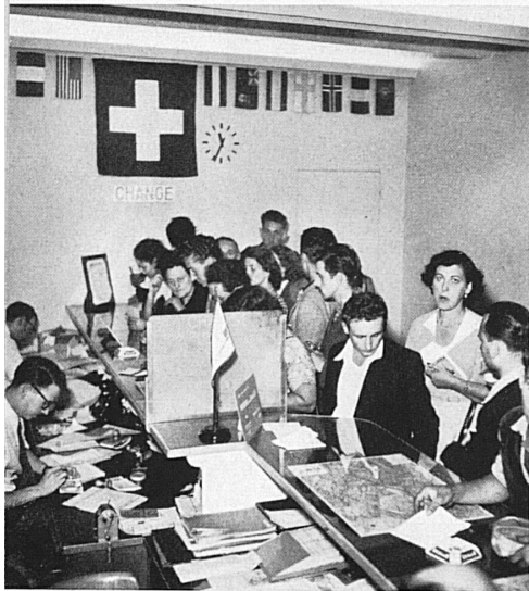
Même des possibilités de change existent dans les offices de tourisme suisses les plus importants. — Selbst die Möglichkeit des Geldwechsels schon im Heimatlande besteht in den wichtigsten der Schweizer Verkehrsbiros.