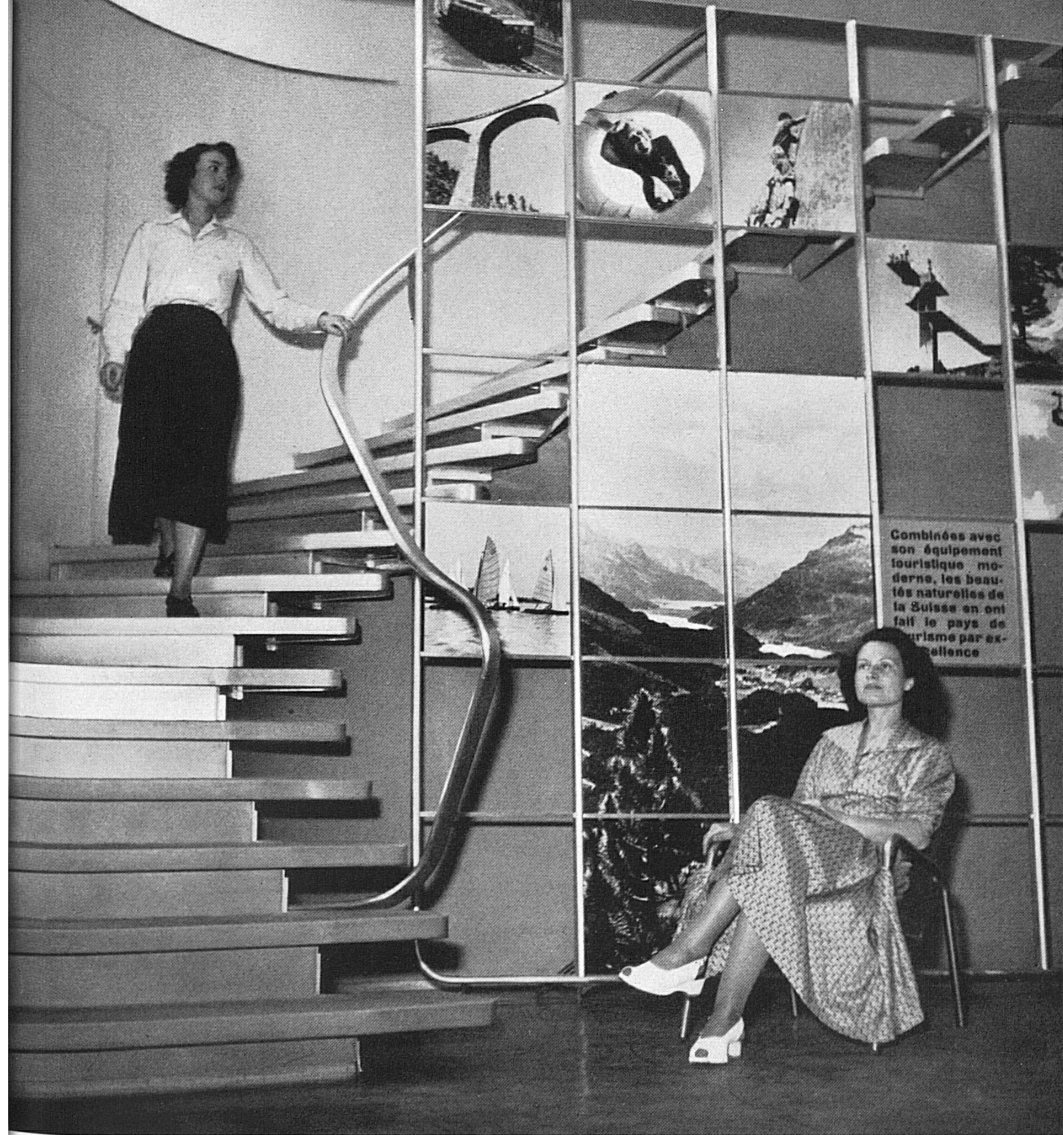
En haut: La montée des escaliers de l'agence de Paris qui vient d'être rénovée est décorée avec goût. — Oben: Der Treppenaufgang der neu eingerichteten Pariser Agentur ist geschmackvoll und zur Reise anreizend dekoriert worden.