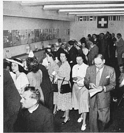
Activité intense dans les locaux d'un office suisse de tourisme. A certaines heures de la journée, l'affluence est telle que les clients sont obligés de faire la queue. — Hochbetrieb in den Räumlichkeiten eines Schweizer Verkehrsbüros. Zu gewissen Tageszeiten wird selbst Schlange gestanden, so groß ist der Andrang.