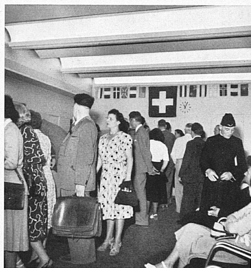
Du directeur de banque à l'ouvrier, de la couturière à l'ecclésiastique, tous ont l'ardent désir de visiter la Suisse. — Vom Bankdirektor zum Arbeiter, von der Schneiderin zum Geistlichen ..., alle wünschen sie nach der Schweiz zu fahren.