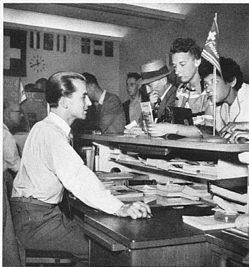
Des milliers de renseignements sont donnés journellement par l'employé au comptoir. On s'arrache littéralement les prospectus. — Tausende von Auskünften im Tage muß der junge Mann erteilen. Die Prospekte gehen weg wie frische Weggli. Stets neuer Nachschub ist nötig.