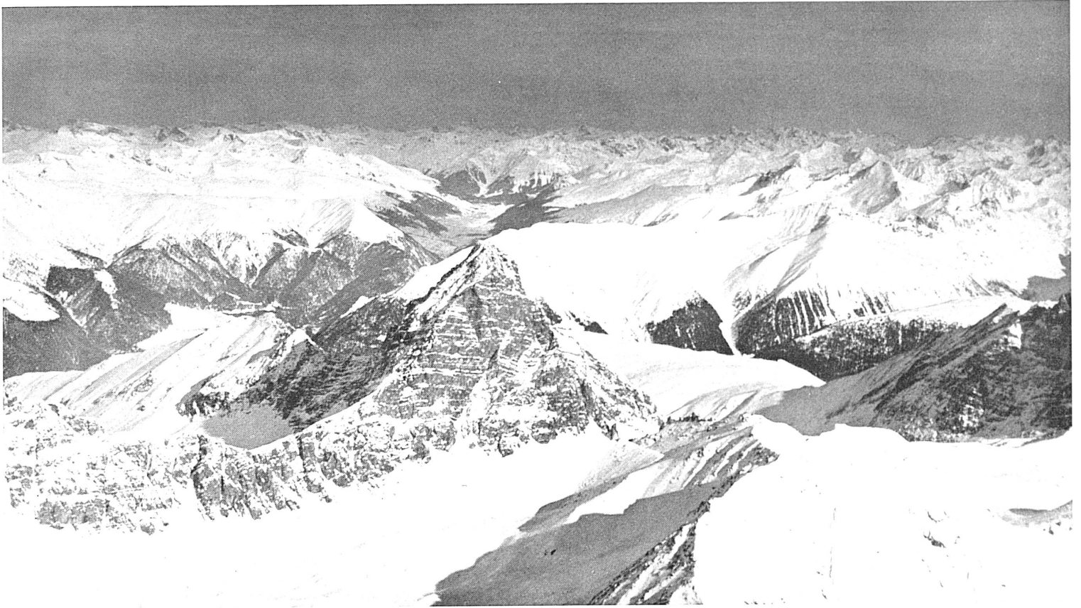
Oben: Das Wahrzeichen der Davoser Landschaft, das markante Tinzenhorn, von der Rückseite, mit Blick in den Davoser Talboden und gegen das Parsenengebiet links davon. — In alto: Il Tinzenhorn visto da tergo e colpo d'occhio sul fondovalle di Davos.