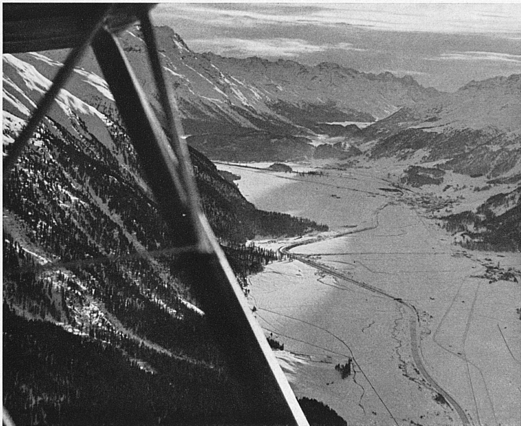
Oben: Blick auf den Talboden des Oberengadins bei Bever-Samedan. In der Bildmitte der Hangar des Oberengadiner Flugplatzes. Im Hintergrund die Gegend von St. Moritz und die Bergeller Berge. — In alto: Veduta del fondovalle dell'Alta Engadina presso Bever-Samedan. Nel centro la rimessa dell'aerostalo dell'Alta Engadina. Nel fondo i dintorni di St. Moritz e i monti della Bregaglia.

Die Aufnahmen dieser beiden Seiten stammen zu einem guten Teil von einem Flug, der letzten Winter anlässlich der Olympischen Spiele in St. Moritz unternommen wurde. Gewiß, die allerwenigsten der vielen Gäste des Bündnerlandes reisen durch die Luft ans Ziel ihrer Wünsche; zumal da auch gar keine regelmäßige Flugverbindung zwischen dem Unterland und etwa dem Engadin besteht, vertrauen sie sich den bequemen und auf ihre Art flinken Wagen der Rhätischen Bahn an und kennen dann die durchfahrene Landschaft eben aus der Bodenperspektive. Den-