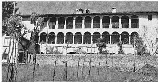
Monteggio: Casa Passera.