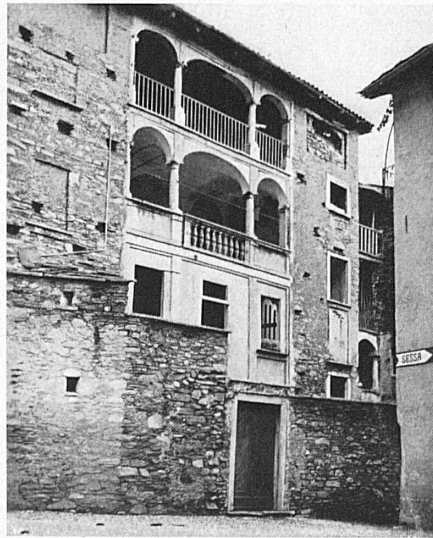
Astano: Cà da Roma.