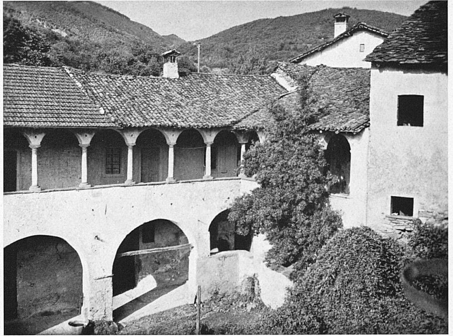
Beredino: Casa Rossi.