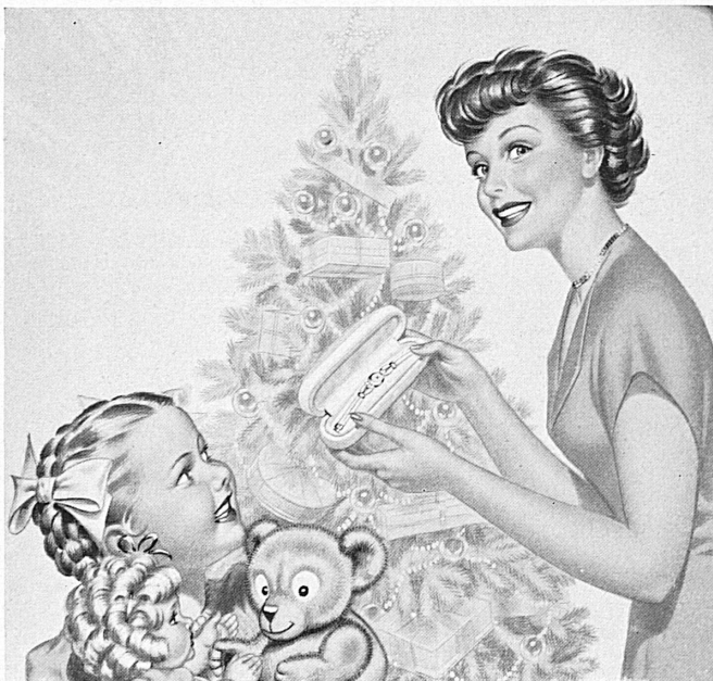
L'arbre de Noël joie d'un soir, Doxa joie d'une vie