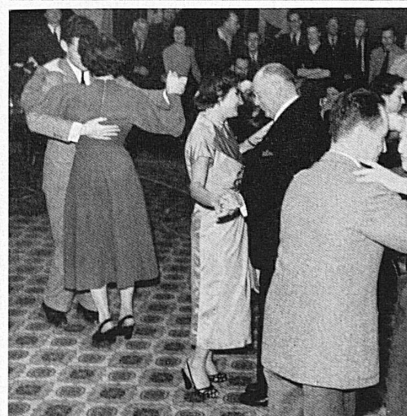
Ci-dessus: Après-ski. Les heures d'entraînement intensif se résolvent en joyeuse détente. Oben: Après-Ski! Die Stunden harten Trainings und eifrigen Skischulbetriebs münden in fröhliche abendliche Unterhaltung.