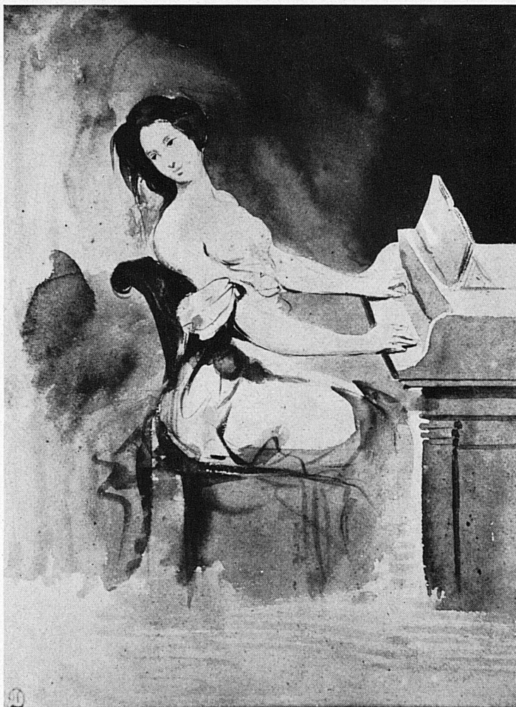
A droite – rechts: Delacroix: L'amoureuse au piano. – Collection privée, France.