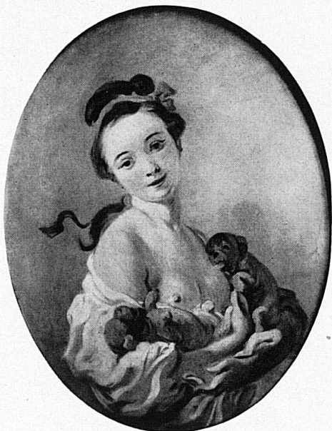
A droite – rechts: Fragonard: La jeune fille aux chiens. – Collection privée, France.