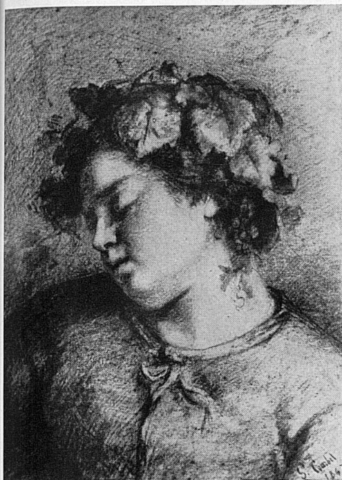
Ci-dessus – oben: Courbet: Femme endormie. – Collection privée, France.