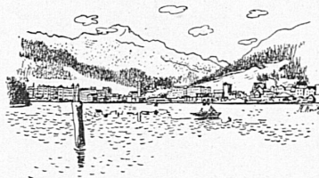
St. Moritz-Bad Zeichnung von F. Krumenacher