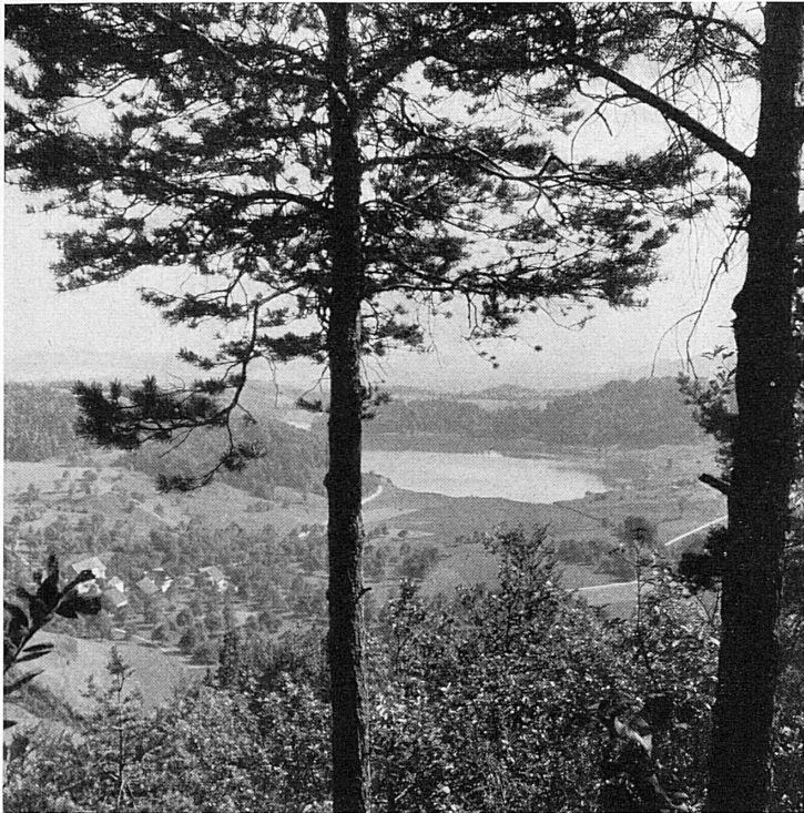
Soppensee (Luzerner Mittelland)