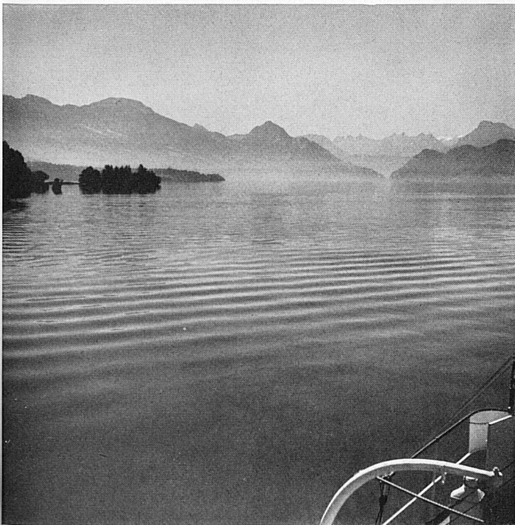
Die Weite des Vierwaldstättersees – Lac des Quatre-Cantons