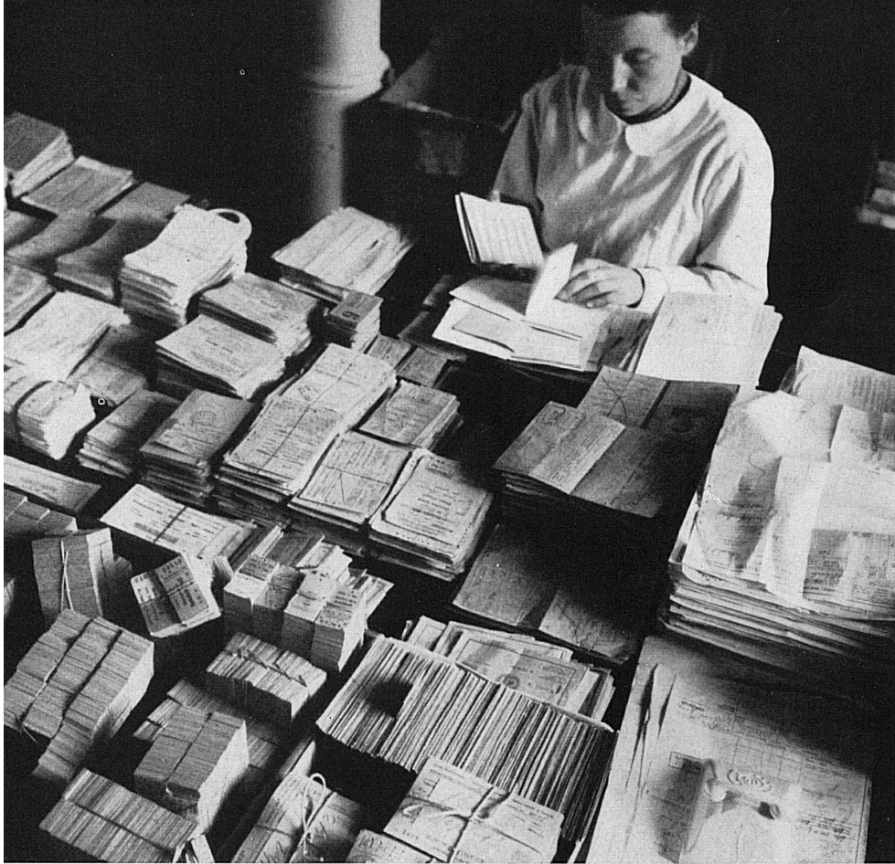
Oben: Das Sortieren und Nachkontrollieren unzähliger Arten von Fahrscheinen im Verwaltungsdienst des Billetwesens erfordert sorgfältige und gewissenhafte Arbeitsleistung.

Ci-dessus: Tous les services d'un chemin de fer exigent du soin et un travail consciencieux; avec la multiplicité des titres de transport, celui des billets ne fait pas exception.