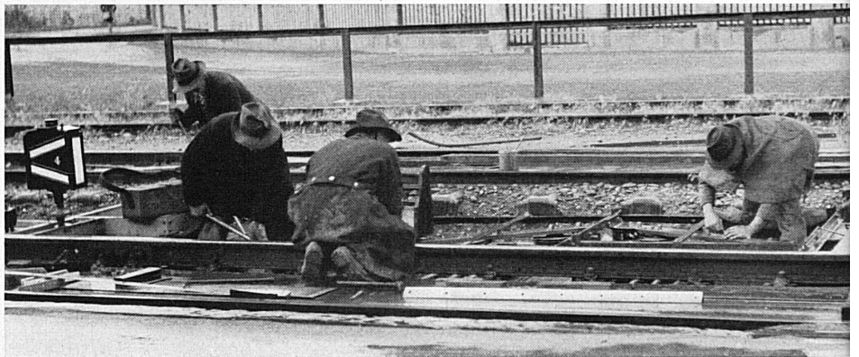
↑ Oben: Bei Wind und Wetter haben die Männer der Schiene, wo es nottut, ihr Werk zu verrichten.

Ci-dessus: Malgré les intempéries ou la mauvaise saison, les ouvriers de la voie doivent effectuer leur travail au moment et à l'heure où le besoin s'en fait sentir.