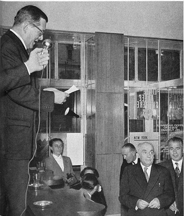
Unten: Unter den geladenen Gästen bei der Einweihung bemerkte man Alt-Bundesrat Minister Dr. Celio (Mitte) und Architekt A. Meili (rechts), den Präsidenten der SZV.