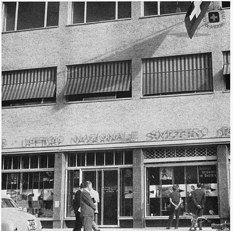
In alto: La facciata dell'edificio con le vetrine dell'agenzia dell'Ufficio centrale svizzero del turismo.