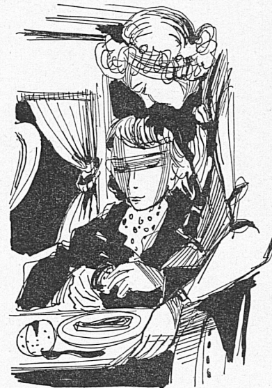
Dessin de J. Schedler

Cela n'empêche pas les entreprises de transports aériens de tendre, aujourd'hui, leurs efforts vers une amélioration constante de leur service à bord. Et lorsqu'on voit ce qui est servi, par exemple, sur les lignes transatlantiques de la Swissair, on admire l'ingéniosité de ceux qui sont chargés de satisfaire aux désirs gastronomiques des passagers. Vi