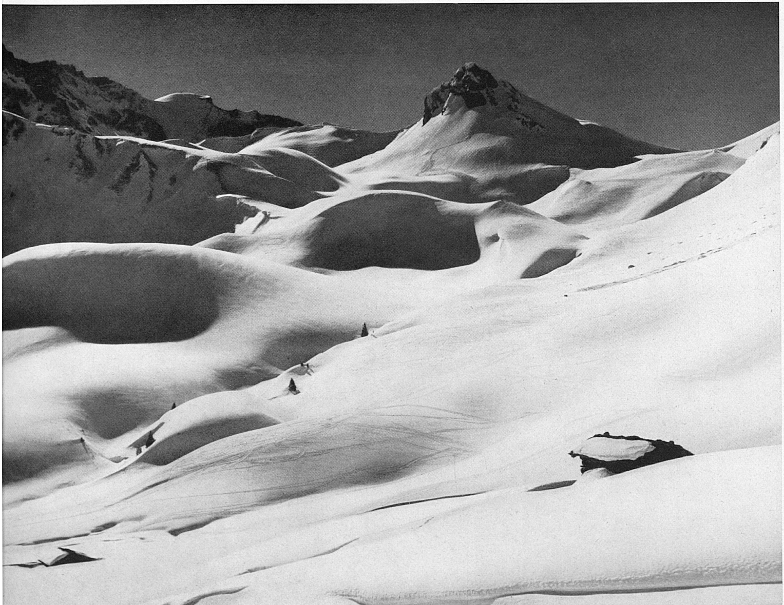
Unten: Die herrlichen Skigefilde von Adelboden. Ci-dessous: Les champs de ski d'Adelboden dans toute leur gloire.