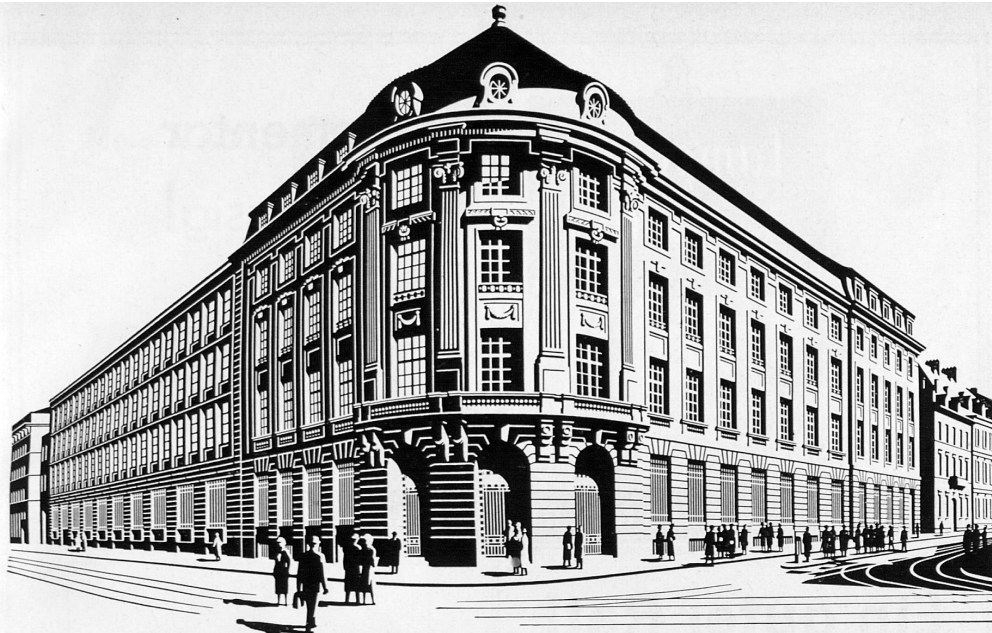
Bankgebäude in Basel – Hôtel de la Banque à Bâle