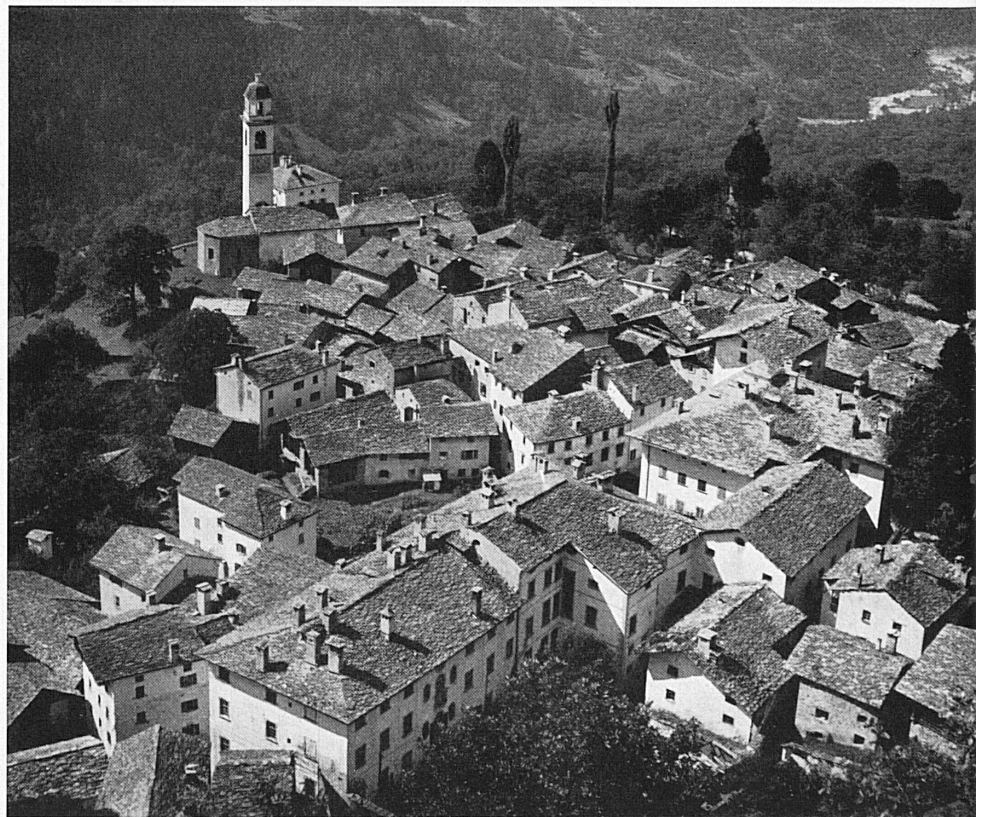
Oben: Soglio, der auf einer Terrasse sitzende, schon ganz südlich anmutende reizvolle Bergeller Flecken.

A gauche: En gare de St-Moritz, les cars postaux attendent les touristes qui se rendront à la Maloja et dans le val Bregaglia.