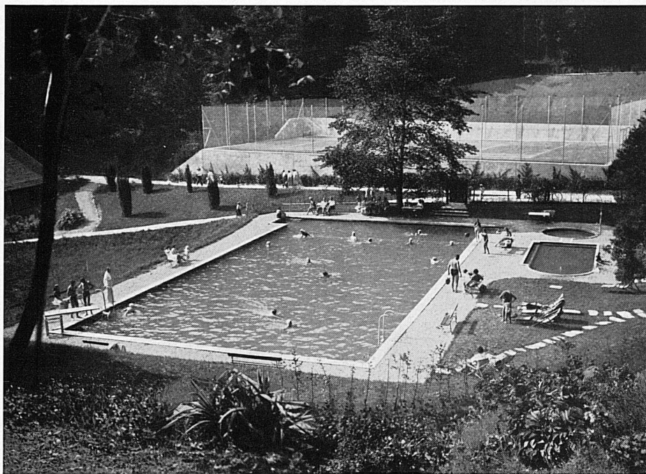
Geheiztes Schwimmbad auf Gießbach