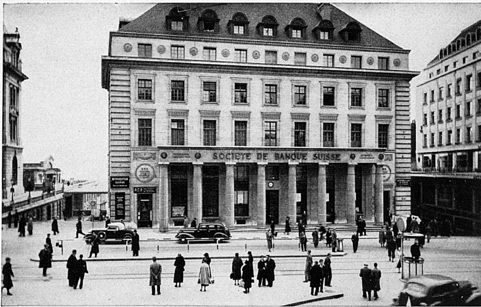
Hôtel de la banque à Lausanne - Bankgebäude in Lausanne