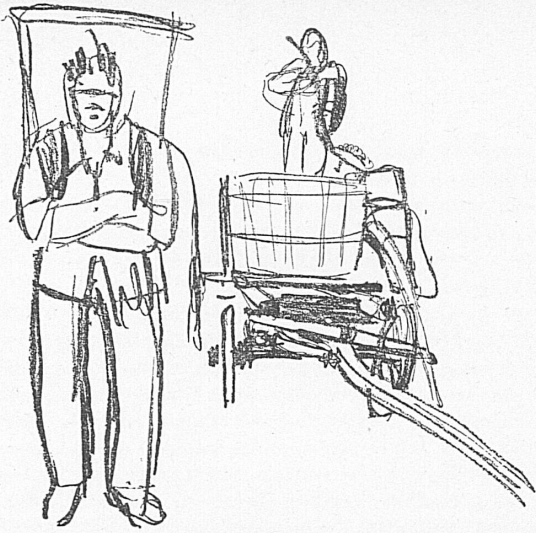
Zeichnungen von - Dessins de Pierre Gauchat