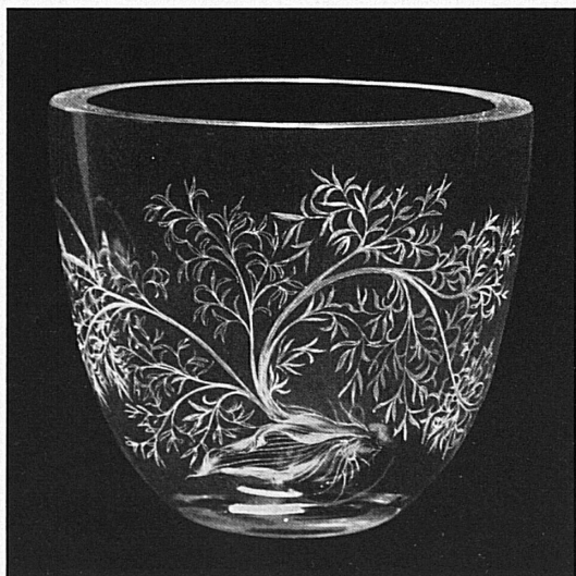
Incisione al diamante su cristallo, di Gertrud Bohnert, Lucerna, † 1948. — Dessin au diamant sur cristal de Gertrud Bohnert, Lucerne, † 1948. — Diamantzeichnung auf Kristallglas von Gertrud Bohnert, Luzern, † 1948.

Gibt es ein anderes Handwerk, das so zeitlos das Leben der Menschen begleitet, wie das Handwerk des Töpfers, das gestern wie heute Alltagsbedürfnissen diene und dient und uns darüber hinaus noch festlich zu beglücken vermag? Oben: Am Brennofen einer bernischen keramischen Werkstätte.