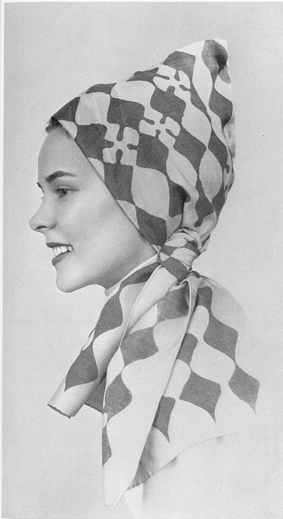
Handbedrucktes Kopftuch aus dem Atelier Alice Eggenberger, Zürich. – Fichu imprimé à la main sortant de l'atelier d'Alice Eggenberger, de Zurich. – Fazzoletto da testa, stampato a mano, Atelier Alice Eggenberger, Zurigo.

Il lavoro artigianale rappresenta una delle più nobili attività umane perchè ha come premessa l'impulso creativo. Esso è di tutti i popoli e di tutti i tempi. Anzi, ci siamo addirittura abituati a giudicare il livello culturale di un popolo appunto dalla qualità del suo artigianato, che in molti casi costituisce la base della prosperità economica di un paese.