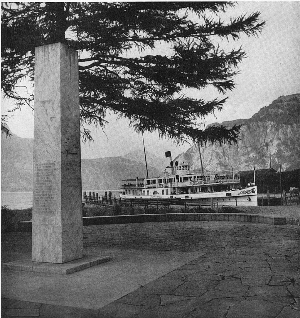
A gauche: Monument en l'honneur de E. Huber-Stockar, pionnier de l'électrification des CFF, sculpté par Franz Fischer, à la gare de Flüelen.

Links: Selbst an der Ausschmückung von Bahnhofplätzen waren die SBB maßgebend beteiligt: das zu Ehren des Pioniers der SBB-Elektrifikation, E. Huber-Stockar, von Franz Fischer geschaffene Denkmal bei der Station Flüelen.