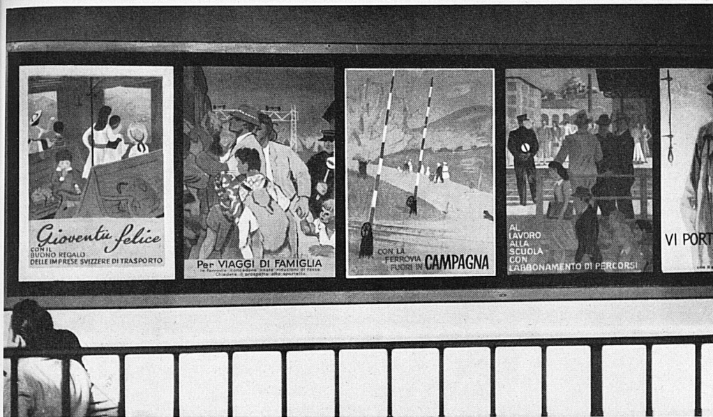
A gauche: Les affiches des CFF créées en cinquante ans révèlent tout le développement des arts graphiques suisses.

Links: An den in fünfzig Jahren erschienenen SBB-Plakaten kann man die ganze Entwicklung der schweizerischen Plakatkunst verfolgen.