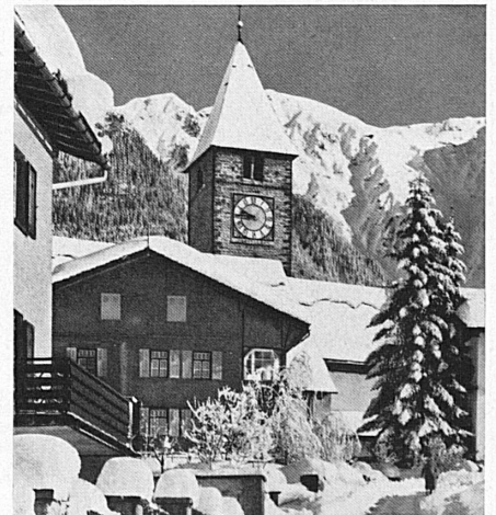
Oben: Im alten Klosters — Ci-dessous: Au vieux Klosters.