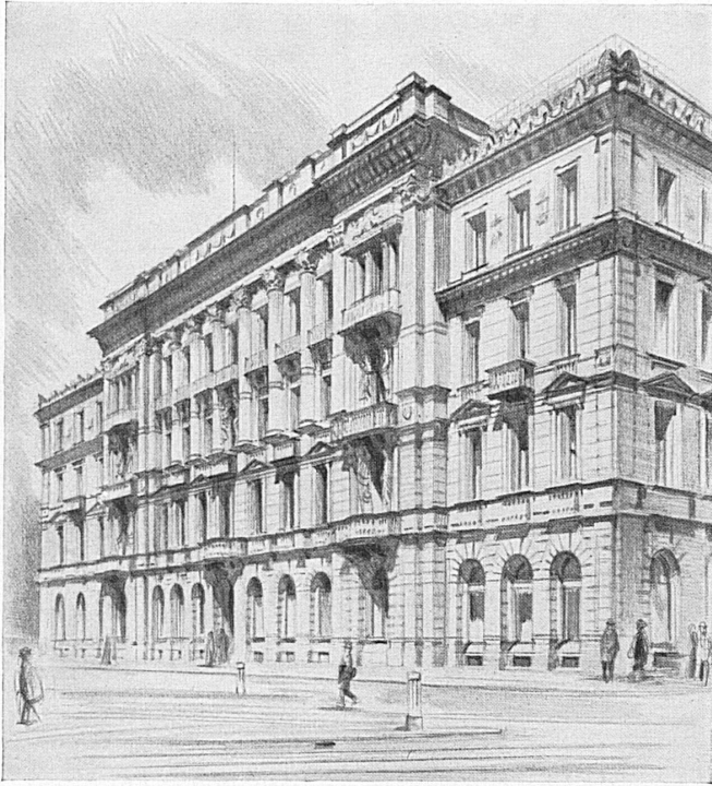
Hauptsitz in Zürich