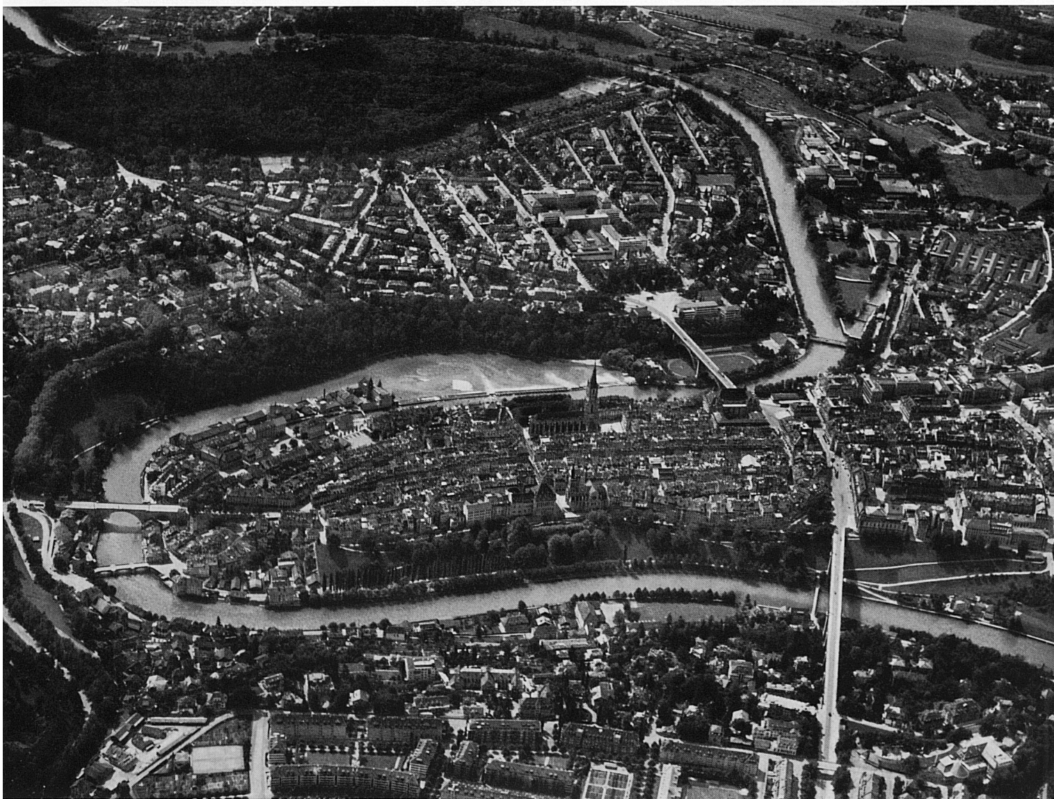
Das Flugbild des alten Bern ist Bild der Planung und Ordnung. Keine andere Schweizer Stadt kennt den Rhythmus der Bogengänge in solcher Konsequenz der Durchführung. In der Melodie der Gassen klingt das Lied der Aare mit. In der Bildmitte das spätgotische Münster.