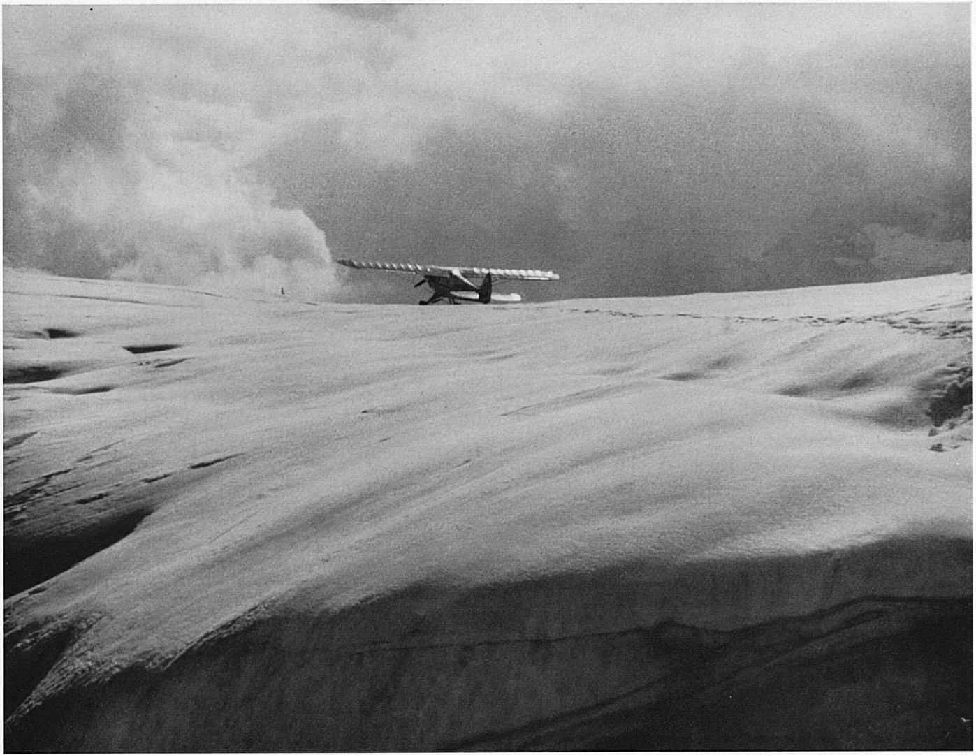
Landung eines Sportflugzeuges auf dem Kanderfirn. — Atterrissage d'un avion de sport sur le glacier de la Kander. Atterraggio di un aeroplano sportivo sul Kanderfirn. — A light plane lands atop the Kander Növé.