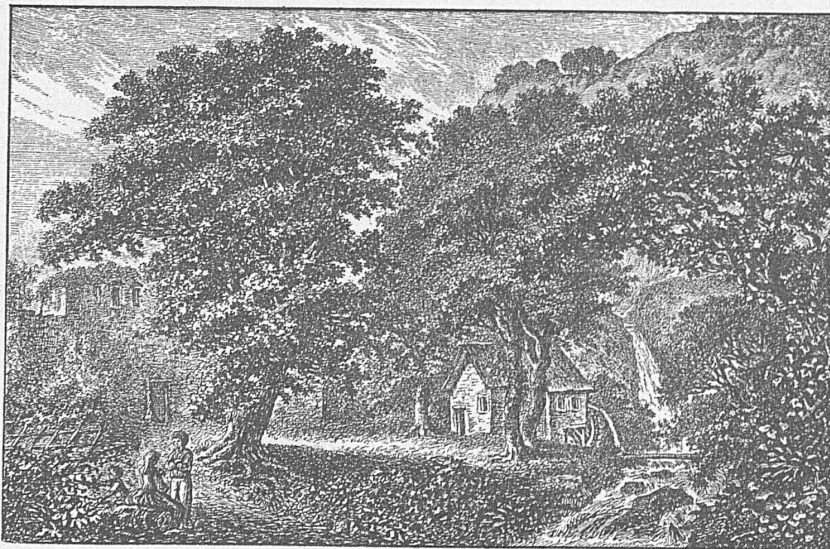
Molinetto nei dintorni di Locarno. Acquaforte di Johann Heinrich Meyer, Zurigo 1755 fino a 1820 «Molinetto» non loin du lac de Locarno. Eau-forte de Johann Heinrich Meyer, Zurich 1755-1820 Molinetto unweit vom Locarner See. Radlerung von Johann Heinrich Meyer, Zürich 1755-1820