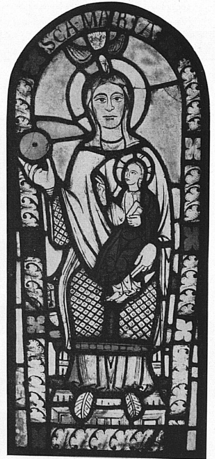
Farbaufnahme des Titelblattes von Clichés Schwitter AG, Basel-Zürich

ZU UNSEREM UMSCHLAGBILD: Am Anfang der uns überlieferten Glasmalereien in der Schweiz steht die Marienscheibe aus der St.-Jakobs-Kapelle ob Flums (St. Gallen). Das um 1150 entstandene Glasmosaik wird heute im Schweizerischen Landesmuseum in Zürich aufbewahrt. Der Bildausschnitt zeigt die in erhabener Frontalität verharrende thronende Maria mit Kind. Dem nur 65 cm hohen und 28 cm breiten Glasbild ist eine später nie mehr erreichte monumentale Wirkung eigen. Beachten Sie auf Seite 7 den Hinweis auf das prächtige Bändchen «Alte Glasmalerei in der Schweiz», herausgegeben von der Schweizerischen Zentrale für Verkehrsförderung, Zürich.