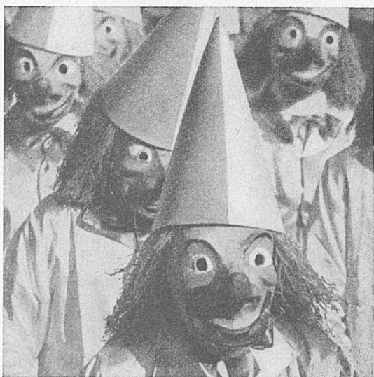
Fasnacht in Basel - Carnaval bâlois

Nous ne saurions détailler les innombrables manifestations sportives sur neige et sur glace qui divertissent les hôtes des belles stations hivernales. Rappelons toutefois les élégants défilés de mode qui ont lieu à la mi-février, à Saint-Moritz. Le Tessin a une originale façon de fêter le carnaval avec son succulent risotto préparé en plein air, sur les places publiques de Bellinzone le 15 février, sur celles de Lugano les 16 et 19 et d'Ascona le 17.