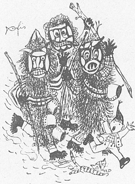
Zeichnung - Dessin de Hans Fischer