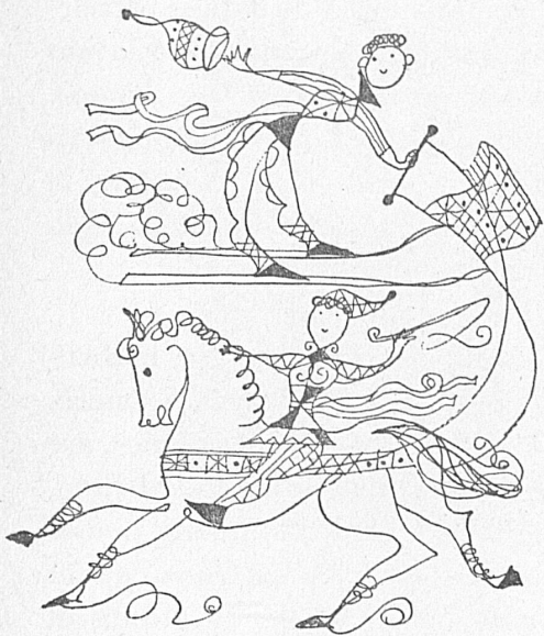
Vignette de Hans Fischer

Les Diablerets, au pied de nobles sommets, face au cirque de Creux-de-Champ, forment la vraie station de montagne alors que la vaste région de Villars-Chesières-Bretaye, avec Gryon comme sentinelle avancée, unit les joies sportives et les itinéraires variés aux plaisirs divers de la vie de société. Partout, le skieur, le patineur, l'ami du curling, le promeneur à traîneau trouvent tous les agréments d'une vie saine. JEAN NICOLLIER