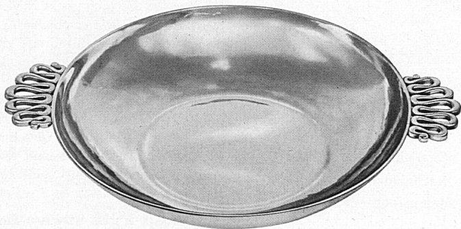
Schale nach eigenem Entwurf