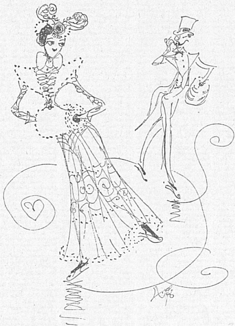
Rhythmen auf dem Eis gestern und heute Rythmes sur la glace, hier et aujourd'hui gezeichnet von - dessinés par Hans Fischer