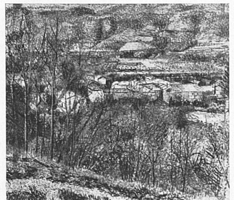
Titelbild: Kommentar in deutscher Sprache auf der ersten Seite des redaktionellen Teils